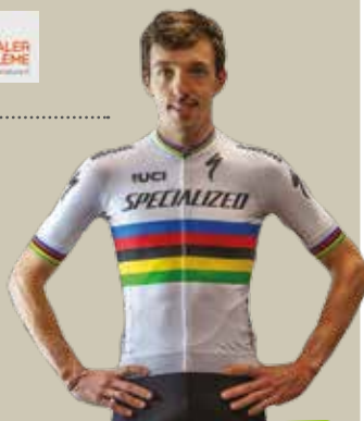
Jordan Sarrou, champion du monde 2020 et ambassadeur de notre espace VTT